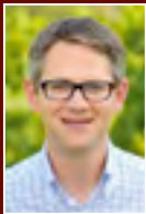
Sehr geehrte Weingenießer,

ein ereignisreiches Jahr neigt sich langsam seinem Ende zu: Stolz blicken wir auf ein gelungenes Fest zum 900 Jahr Jubiläum zurück, das, Gäste und Fachpublikum ebenso begeisterte, wie unsere neu kreierte TOP-Jubiläumsedition VELUM. Die Cuvée ist natürlich noch in unserer Stiftsvinothek erhältlich, allerdings streng limitiert, ebenso wie unser Weingartenpfirsichnektar, also rasch zugreifen!