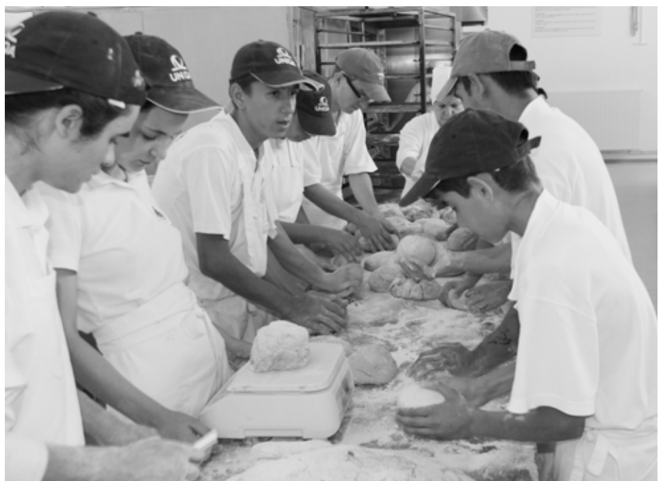
Eine Erfolgsstory: Die Bäckerei im COC ist Berufsschule und ein florierender Betrieb.