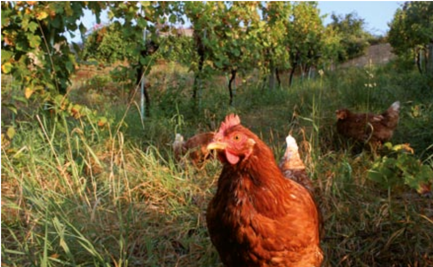
Hühner übernehmen die Bodenpflege in einem Weingarten. Sie lockern den Boden und kümmern sich um die Unkraut-Regulierung.

tionelle Lösung, wie beispielsweise die versuchsweise Haltung von Hühnern zwischen den Rebzeilen. Sie lockern den Boden und kümmern sich um die Unkraut-Regulierung.